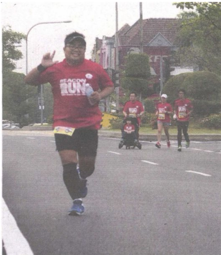
Some of the more than 800 people who took part in the Beacon Run 2016.