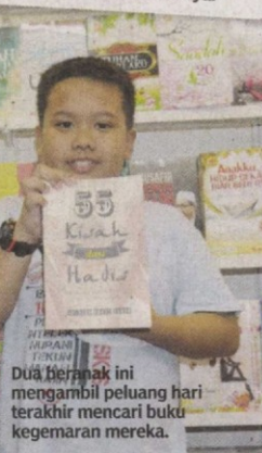
Dua beranak ini mengambil peluang hari terakhir mencari buku kegemaran mereka.