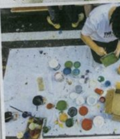
KERJA-KERJA membancuh cat dinding dijalankan secara gotong-royong sukarelawan terfikat.