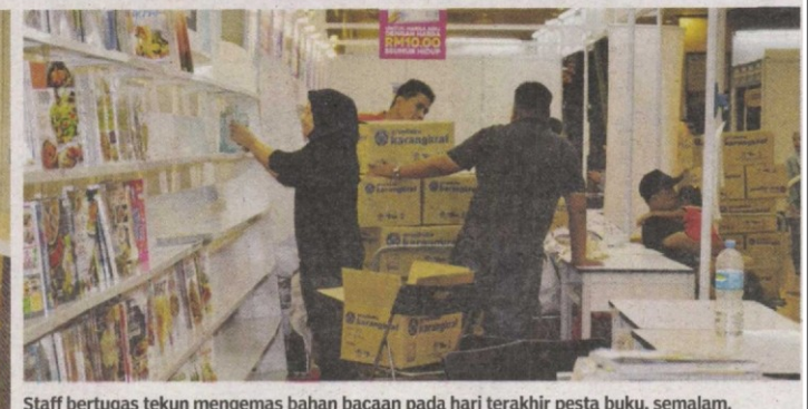
Staff bertugas tekun mengemas bahan bacaan pada hari terakhir pesta buku, semalam.