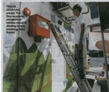
TEKUN... SEORANG pelajar The One Academy melaburkan kanvas mural di dinding lorong belakang Jalan Kenari.