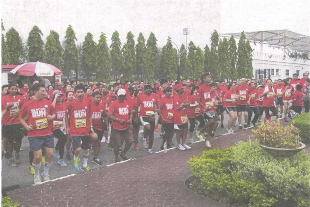
Participants doing warming-up exercises before the run.