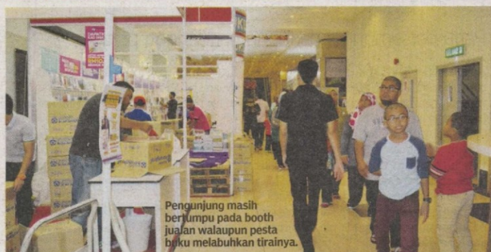
Pengunjung masih berjumpa pada booth jualan walaupun pesta buku melabuhkan tirainya.