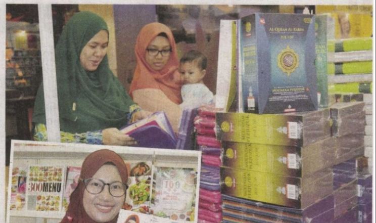
Pengunjung ini sedang membelek al-Quran dan terjemahan yang merupakan naskah paling laris.

Pesta Buku Selangor 2016 yang bermula pada 28 Julai lalu akhirnya menutup tirainya semalam, 7 Ogos pada jam 10 malam.