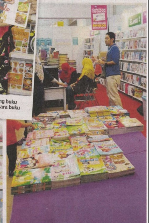
Staff berehat seketika sebelum melakukan kerja-kerja mengemas booth selepas Pesta Buku Selangor yang berlangsung di SACC, tamat semalam.